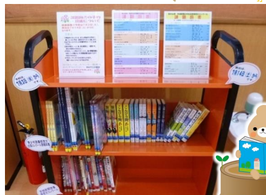
過去の課題図書コーナーのようす